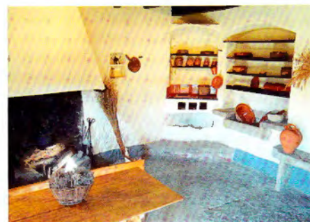
La Casa Museu Verdaguer de Folgueroles amb la seva cuina