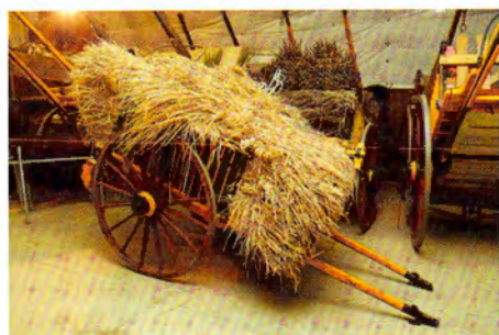
La Cabanya de la Roca i carros de l'Alzinar de la Roca de Taradell (fotografia: