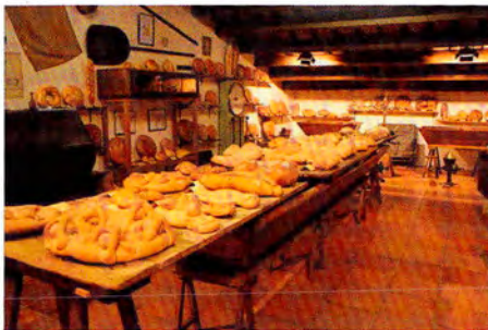
El Museu del Pa de Tona