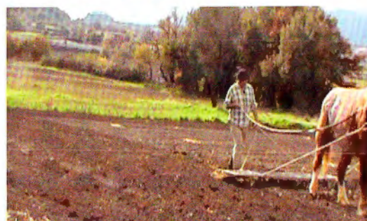
Parcel·lació del camp experimental dels Ametllers al mas El Colomer de Taradell. A la dreta, feina de rasclar el cereal sembrat amb tracció animal