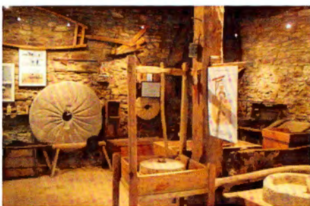
La bassa i l'obrador del Molí de la Calvaria de Calldetenes

Els diversos estaments que promouen el projecte treballen amb la certesa que un equipament patrimonial d'aquestes característiques posarà en valor la comarca com un territori que històricament ha tingut un paper notable en el sector agroalimentari de Catalunya i que es preocupa per la gestió futura d'aquest important patrimoni cultural. En aquest context sociocultural l'Ecomuseu del Blat permetrà donar elements per constituir un referent identitari per a la població de la comarca i un element d'atracció del turisme cultural. L'Ecomuseu del Blat neix amb la voluntat d'aglutinar els diversos agents del món agrari, tant des del