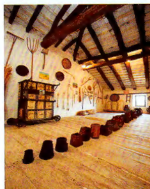
El mas El Colomer de Taradell i sala del Blat